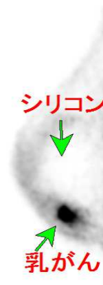
豊胸術後の乳がん