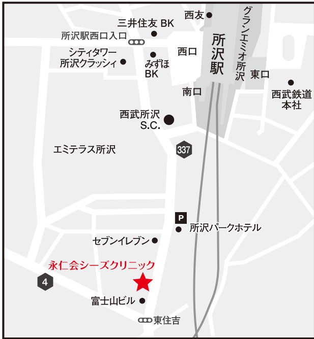
西武池袋線・新宿線「所沢駅」南口より徒歩5分

当院駐車場は駐車できる台数が少ないため、ストレッチャーの方の利用を優先させていただいております。 当院駐車場が満車の場合は周辺のコインパーキングをご自身のご負担でご利用いただくことになりますのでご了承ください。